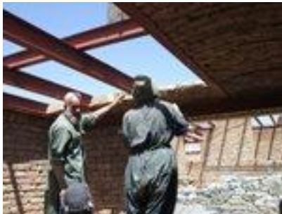
Construction d'une école

Les autorités américaines ont calculé qu'entre le moment où des Talibans sont repérés sur une route afghane et le moment où un missile leur tombe sur la tête, il s'écoule, en moyenne, six minutes. Soit environ trois fois moins qu'il y a une dizaine d'années. Merci les satellites. Merci les drones !