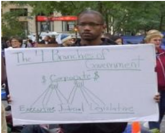
CR : M. S. D. de passage au Zuccotti Park (NY)

Deux jours après avoir été évacués par la police du Zuccotti Park , rebaptisé Liberty Square par les fondateurs de "Occupy Wall Street", les "99 %" qui ont, depuis le 17 septembre essaimé dans près d'une centaine de villes américaines, sont de retour. 30 000 personnes ont manifesté, jeudi 17 novembre, à New York pour fêter les deux mois du mouvement. D'autres manifestations inhabituelles par le nombre de participants ont eu lieu dans 30 villes à travers le pays.